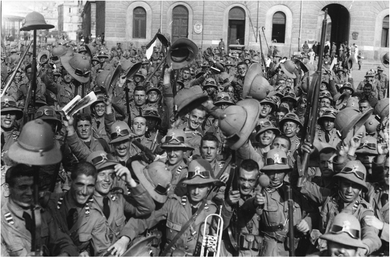
Le truppe del 524° battaglione di mitraglieria in partenza per l’Etiopia

Un discorso carico di furore quello di Mussolini, che il 2 ottobre 1935 annuncia che l’Italia entra in guerra con l’Etiopia. Il discorso pronunciato dal Duce è un concentrato retorico virulento di tutte le umiliazioni subite e accumulate nella memoria nazionale : la volontà di riscattare la disfatta di Adua del 1896, la vittoria mutilata dopo la prima guerra mondiale, lo scontro tra nazioni borghesi e nazioni proletarie. L’occasione politica arriva all’improvviso: dall’incidente militare di Ual Ual ai confini dell’Etiopia con l’Eritrea (già colonia italiana).