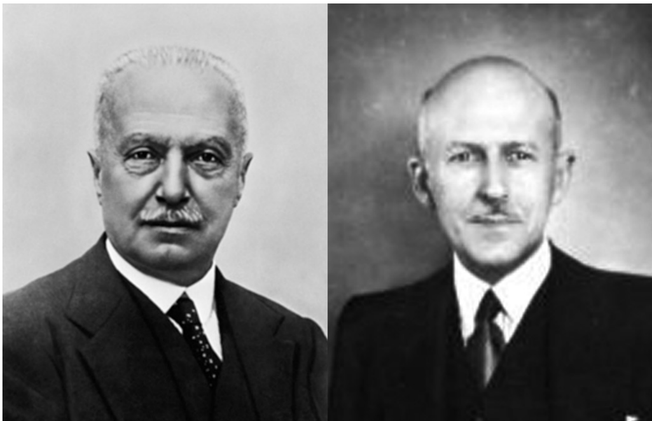
Giovanni Agnelli e Roberto Pirelli

Non meno privilegiati sono i banchieri: il consiglio di amministrazione della "banca commerciale" fa il pieno con 9 senatori e 1 deputato. Il "credito italiano" ottiene 7 senatori e 3 deputati. Il "Banco di Roma" 2 senatori e 4 deputati e fiumi di danaro scorreranno in occasione delle guerre promesse.