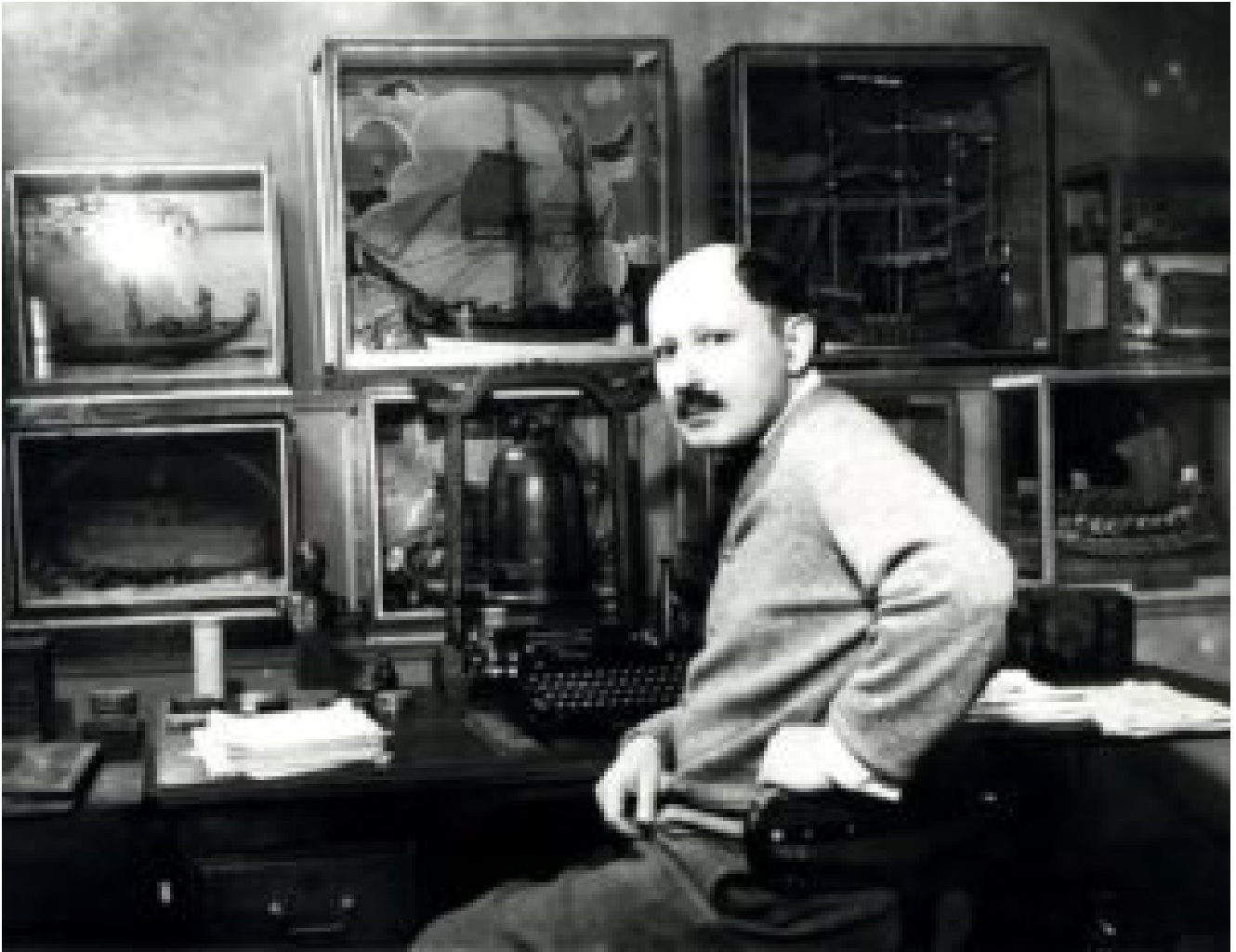
Jean de La Varende con i suoi modellini navali.

Pertanto, la scrittura di La Varende serve ideali chiari che sono: il re, la vera nobiltà, il mondo contadino, la religione cattolica. Fa sì che i suoi personaggi cerchino onore, coraggio, avventura, rispetto. Il suo mondo è allo stesso tempo rinchiuso nelle sue tradizioni ancestrali, una certa etichetta "hobereaute", eppure alcune figure sono ritratte con un personaggio che vuole rompere con le abitudini delle cronache delle castellane, sprofondando nel dramma oltre che nell'umorismo di leggera derivazione britannica.