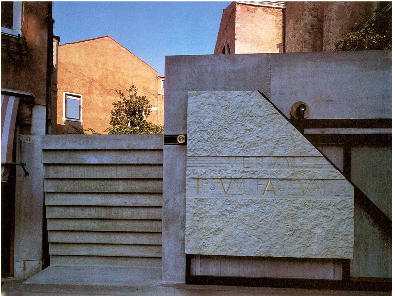
"verum ipsum factum" Gian Battista Vico - Scritta della Facoltà di Architettura di Venezia

Sull'ingresso della facoltà di architettura di Venezia, c'è iscritto nel portale di ingresso "Verum ipsum factum" di Giambattista Vico (filosofo napoletano) che esprime il concetto che le cose autentiche stanno nell'ambito metafisico (punti metafisici) quei punti per Vico sono tridimensionali, mentre le nostre opere che costruiamo nella realtà sono sempre bidimensionali perché sono "l'ombra" i quei punti tridimensionali.