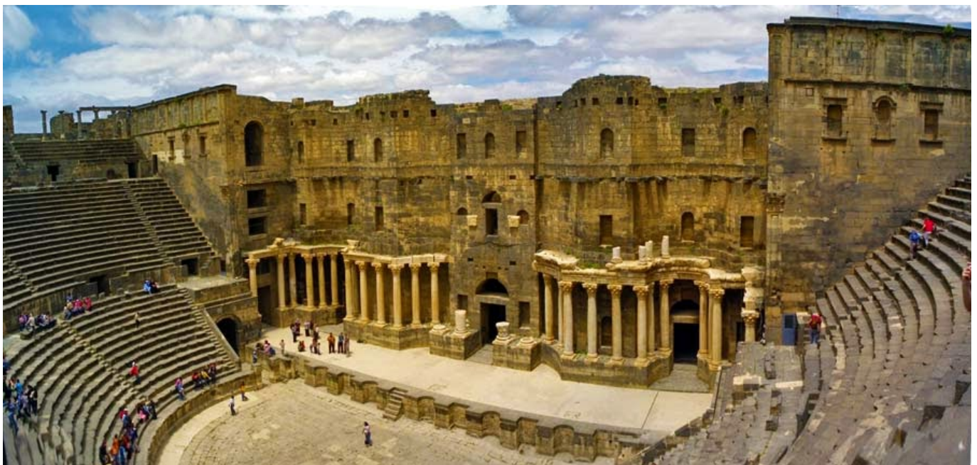
Anfiteatro romano di Bosra in Siria

Dunque l'architetto quando con la sua "opera" commuoverà gli indomabili (altri individui) potrà essere soddisfatto e soprattutto avrà rispettato il mandato che l'architettura gli ha imposto, l'indomabile si può solo rappresentare, dunque l'architettura eaulica è colei che rappresenta gli individui.